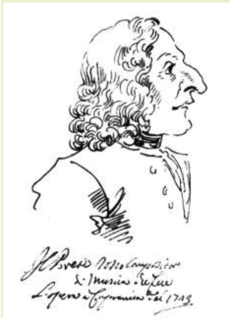
Caricatura de Vivaldi Il prete rosso de Pier